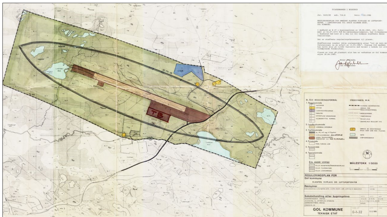
Figur 1: Gjeldende reguleringsplan.

Reguleringsplan for Klanten Flyplass og luftsportscenter er godkjent 14.02.1986: